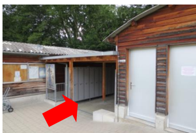
Zugang zur Saunagarderobe/Dusche/WC