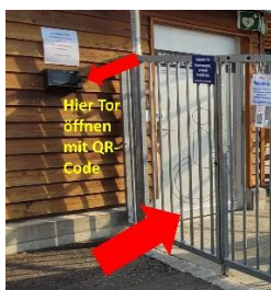
Eingang für Saunagäste