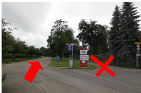
Zufahrt zum Badi-Areal ganzjährig