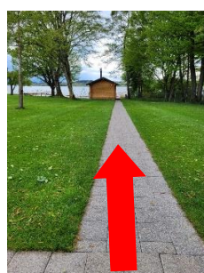
Finnische Blockhaussauna „Sauna am See“